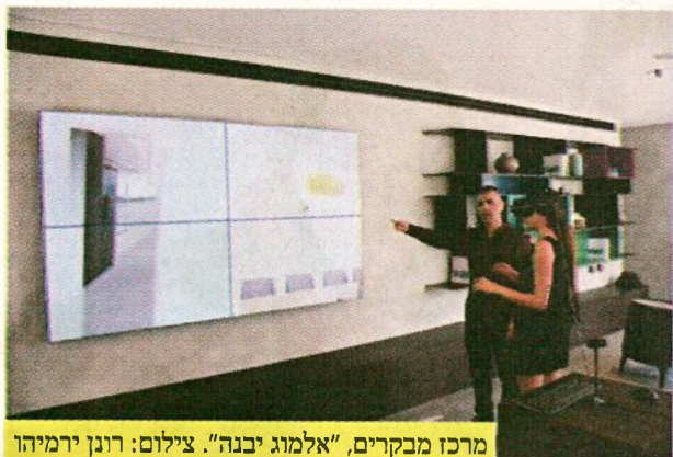
מרכז מבקרים, "אלמוג יבנה".

לבניינים חניונים תת-קרקעיים שיכללו 730 חניות לדירות ועוד כ-100 חניות ציבוריות. תמהיל הדירות כולל דירות 3, 4 ו-5 חדרים ודירות גג מיוחדות.